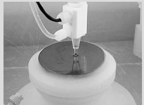
SONOSYS® Megasonic System mit Single Düse bei der Wafer Reinigung

Die im Jahr 1995 gegründete Firma SONOSYS Ultraschallsysteme GmbH ist Hersteller von hochfrequenten Ultraschall-Reinigungssystemen, die u.a. in der Halbleiterproduktion, Photovoltaik und Mikrosystemtechnik eingesetzt werden.