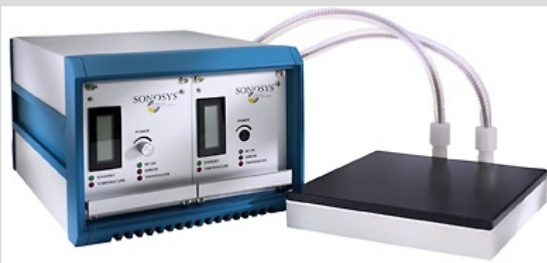
SONOSYS® 1 MHz Megasonic System mit Tauchschwinger