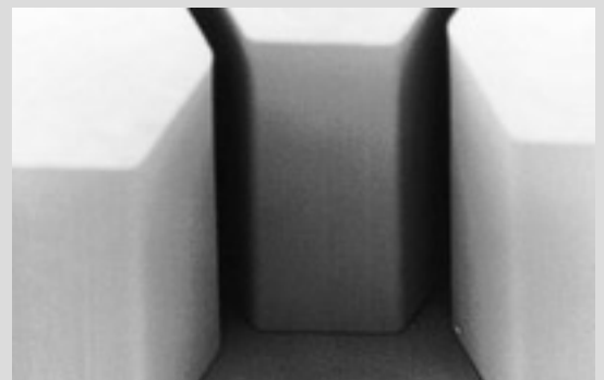
Bild rechts Mikrostruktur nach der Megasonic Reinigung